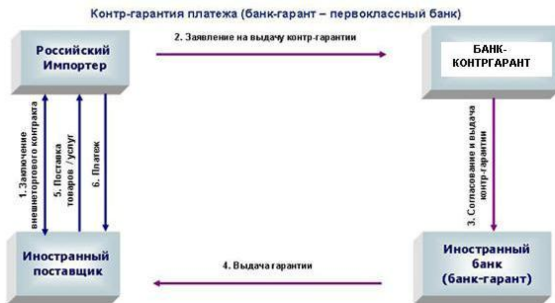
Рис. 1. Схема работы по контр-гарантии

Международная банковская гарантия – это документ, содержащий определенный перечень реквизитов, отражающих сущность сделки. Банковская гарантия должна содержать: информацию о кон-