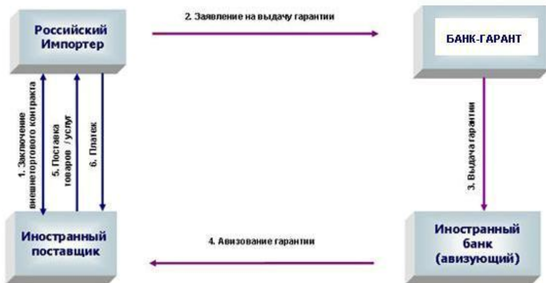
Рис. 2. Схема предоставления прямой международной гарантии

Сегодня существует множество электронных площадок, например, Официаль-