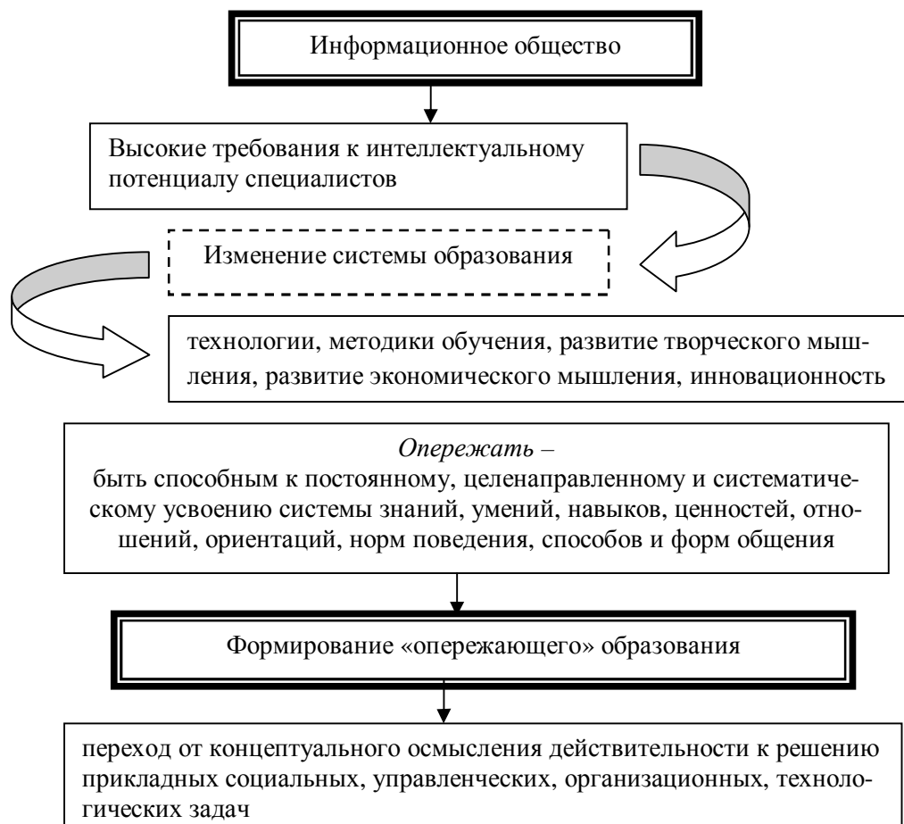
Рис. 1. Инновационная экономика и подготовка высококвалифицированных специалистов

В результате, первостепенными задачами развития системы профессионального образования (ПО) становятся задачи повышения качества и доступности обра-