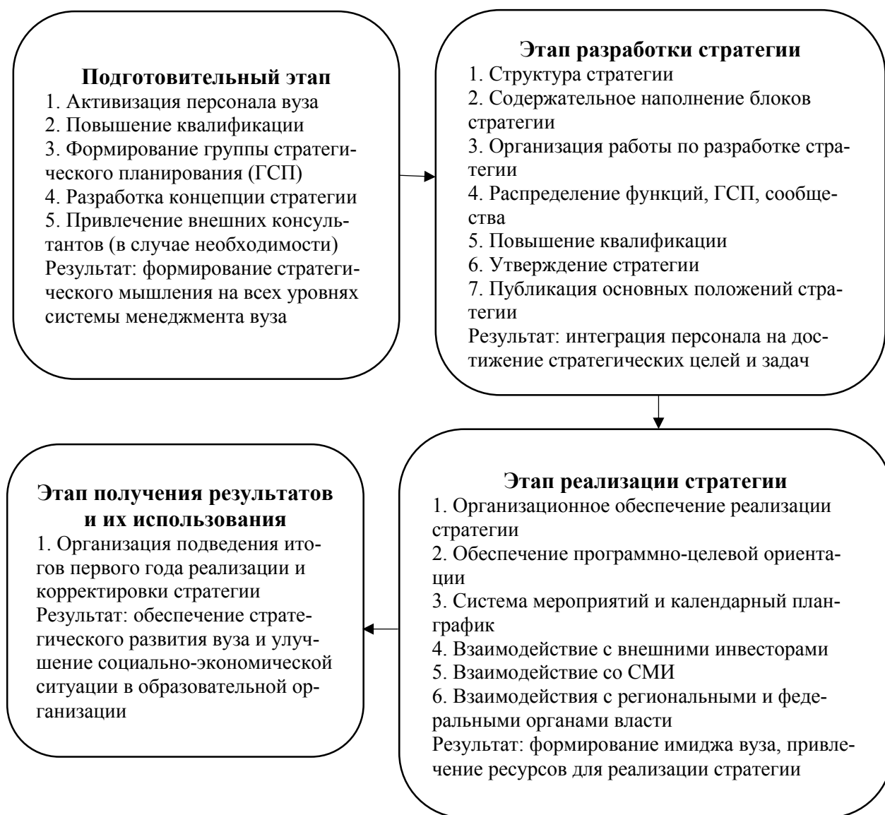
Рис. 1. Этапы разработки и реализации стратегии развития вуза