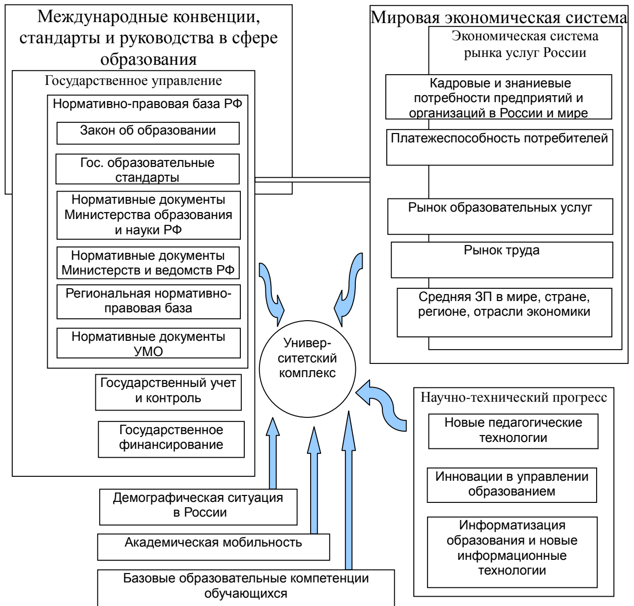
Рис. 2. Факторная модель управления образованием (на примере университетского комплекса)