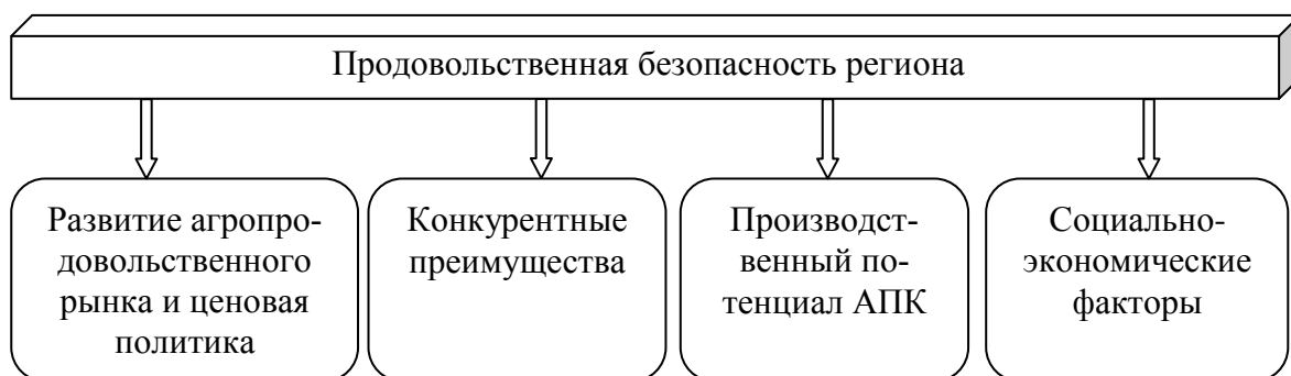
Рис. 1. Факторы, оказывающие благоприятное влияние на обеспечение продовольственной безопасности региона

Производственный потенциал в обобщенном виде автор предлагает отнести к благоприятным факторам. Недостаточное