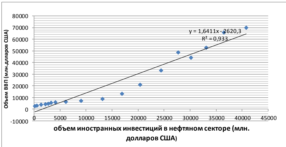
Рис. 1. Корреляционная связь между ВВП и иностранными инвестициями, вложенными в нефтяной сектор Азербайджана

8,15 раз, увеличившись с уровня в 4,6 млрд. долларов в 1990 году до 37,5 млрд. долларов в 2013 году. За период с 1990 по 1995 годы экономический спад проявил себя в доходах и расходах населения. Инфляция, происходившая в те годы, оказала особо серьезное влияние на доходы населения. Начиная с 1995 года, как и в других сферах экономики, начали происходить