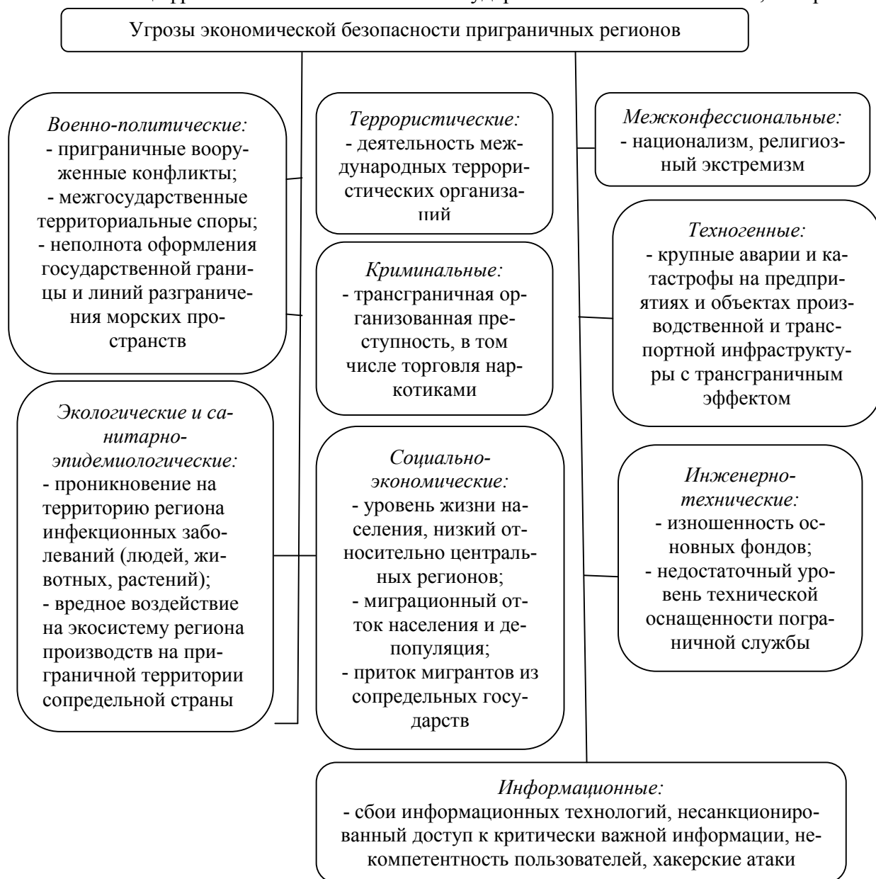
Рис. 2. Угрозы экономической безопасности приграничного региона

Экономическая безопасность приграничных регионов характеризуется большей остротой проявления вызовов экономической безопасности по сравнению с регионами, не имеющими границ с иными государствами. Соответственно, возрас-