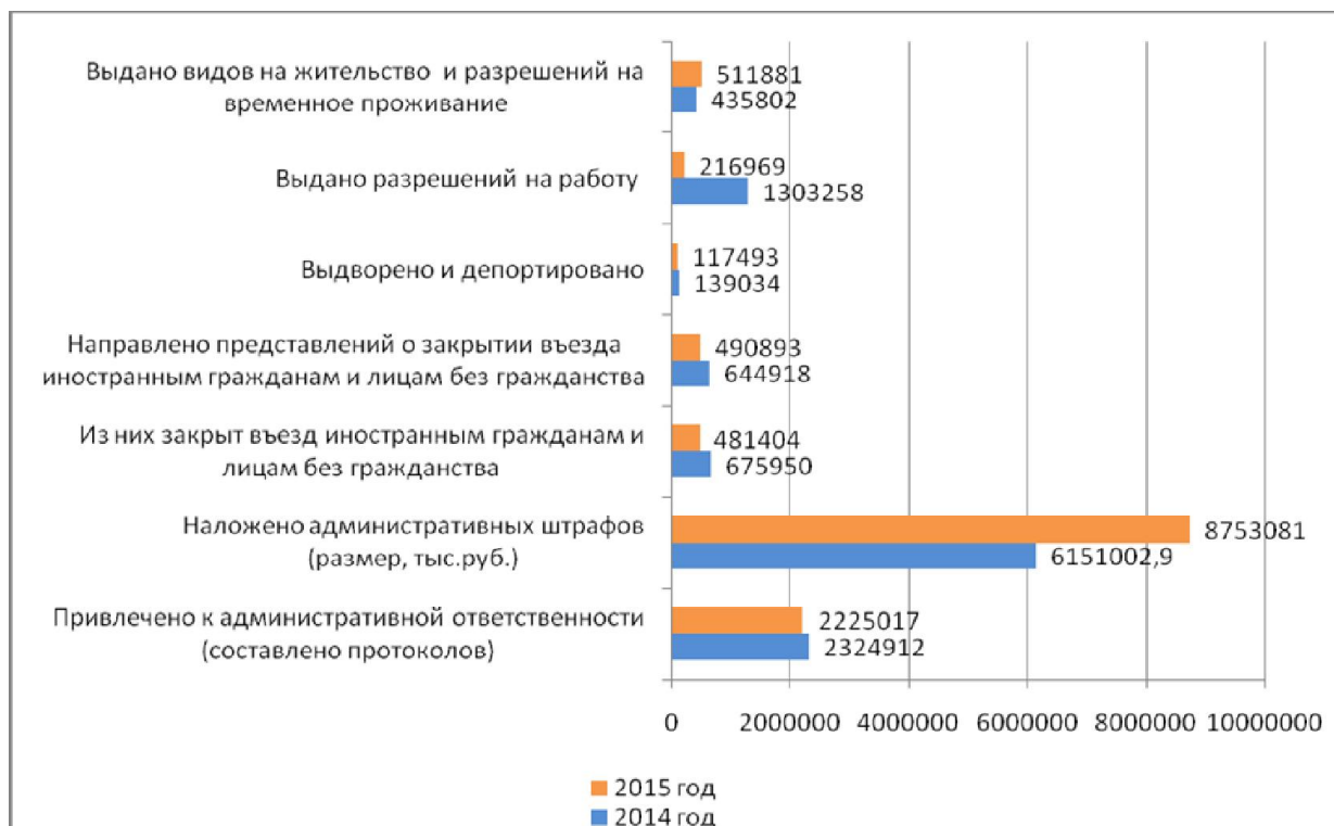
Рис. 2. Влияние миграции на жизнедеятельность общества РФ

ции, к сожалению, привело к возникновению «прописочного» бизнеса, которым занимаются не только физические лица – собственники жилья, но и юридически лица, чаще всего, – агентства недвижимости. Например, в одной квартире площадью 40 кв. м было прописано более 1 тыс. человек [4]. Безусловно, эти тенденции нуждаются в должном правовом регули-