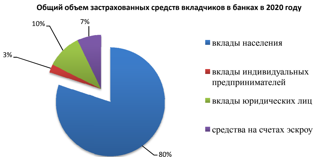
Рис. 1. Общий объем застрахованных вкладов в коммерческих банках в 2020 г.

Отметим, что среди вложений граждан наибольший рост в 2021 г. показали