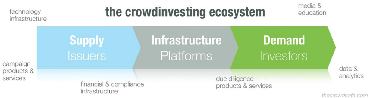
Рис. 2. Схема экосистемы краудфандинга